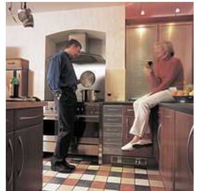
Varme og hygge i et køkken, hvor den diskrete radiator Kickspace giver plads til at udnytte rummet fuldt ud. Bemærk placeringen i soklen under skuffeelementet.